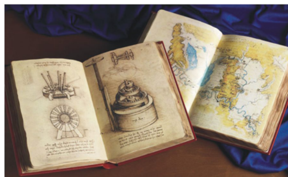
Los Códices Madrid I-II, son los manuscritos de Leonardo da Vinci.