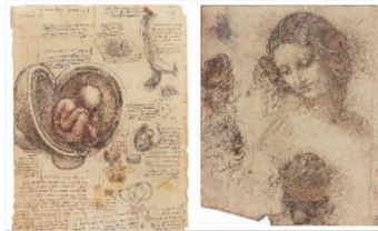
Detalles de Leonardo / Contrastes

Un libro reúne los 200 dibujos más espectaculares del genio renacentista de los 600 que atesora la Royal Collection británica