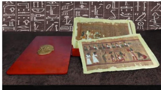
Papirino de Ani / LA COMUNICACIÓN 365

— CM Editores, con sede en Salamanca, ha publicado el primer y único facsímil del Papiro de Ani, el Libro de los Muertos más sobresaliente del antiguo Egipto con 23,6 metros de jeroglíficos e ilustraciones, cuyo original custodia desde 1888 el British Museum.