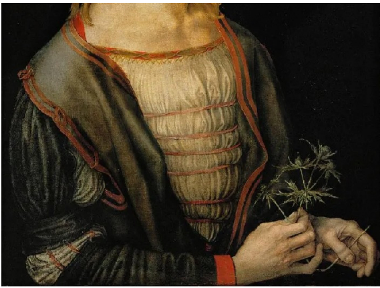
Auto-retrato realizado en 1493.

De su primera formación, Dürero heredó el legado del arte alemán del siglo XV, influido por la pintura flamenca del gótico tardío.