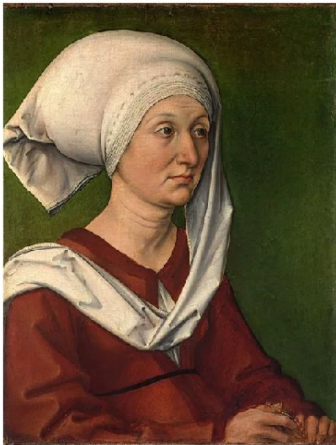
Un Retrato de la madre del artista, fechada en torno a 1490, es la pintura más temprana que se le atribuye con seguridad a Durero.

Durero ejerció una decisiva influencia en los artistas del siglo XVI, tanto alemanes, como de los Países Bajos y llegó a ser admirado por maestros italianos como Rafael Sanzio y Tiziano . Sostuvo contactos con genios como Leonardo da Vinci y Giovanni Bellini . Sus grabados influyeron en los expresionistas alemanes de principios del siglo XX .