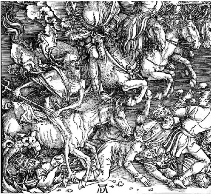
Los 4 jinetes del Apocalipsis. Alberto Durero