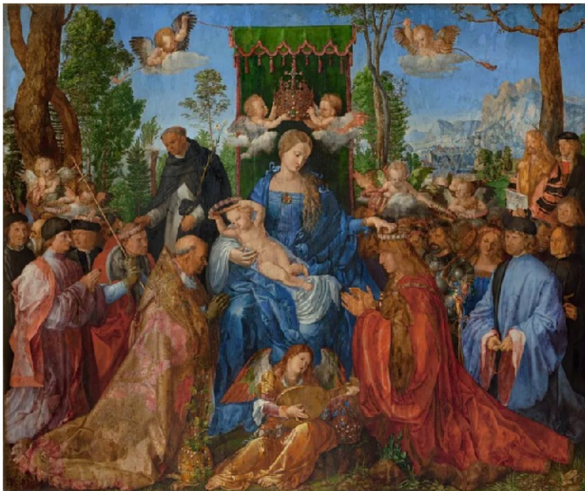
Fiesta del Rosario. Alberto Durero.

El pintor, Alberto Durero, se representó a sí mismo , en la esquina superior derecha, a los pies de las montañas y de un paisaje típicamente alemán.