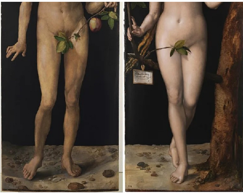
Adán y Eva. Alberto Durero. 1507

En 1513 realizó tres imágenes magistrales: El caballero, la Muerte y el Diablo (1513) . Se trata de un grabado realizado con la técnica del buril.