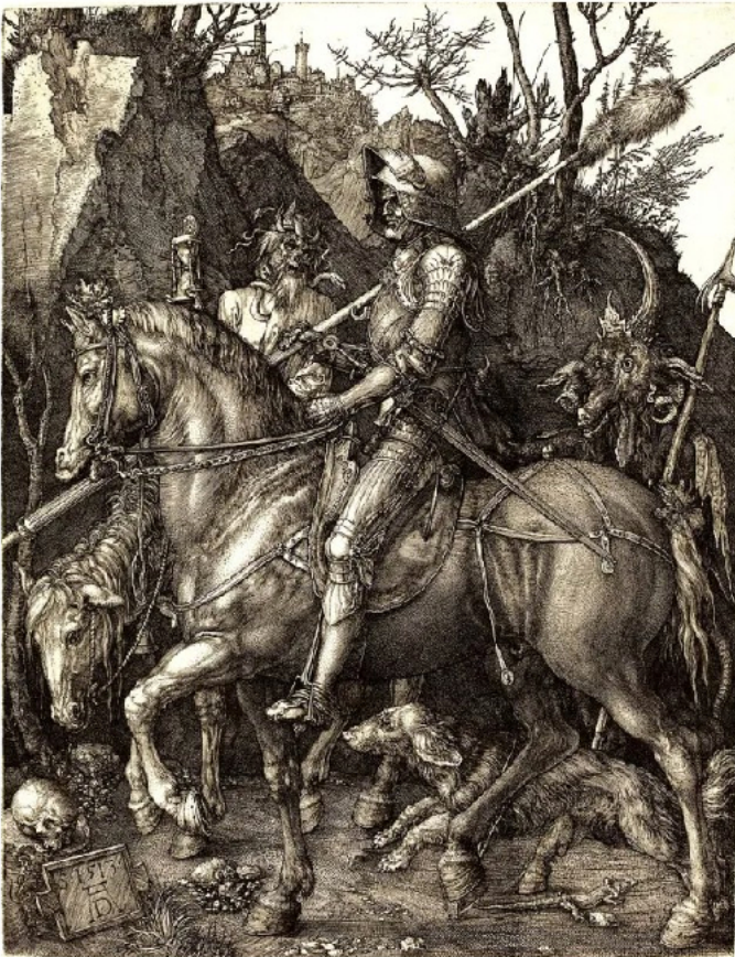
El caballero, la Muerte y el Diablo (1513)

En 1513 realizó tres imágenes magistrales: El caballero, la Muerte y el Diablo (1513) . Se trata de un grabado realizado con la técnica del buril.