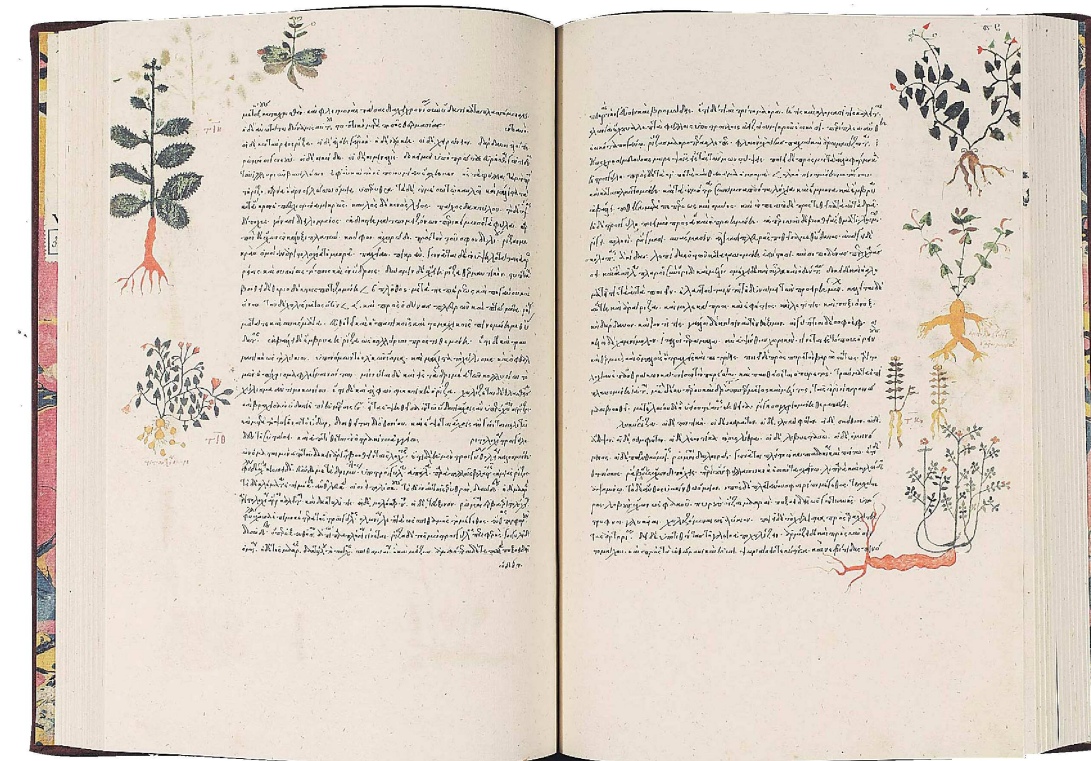
'Dioscórides', un manuscrito sobre medicina reproducido por CM Editores.

Exactitud cromática. Una vez obia el original con una cámara digital extremadamente sensible que recoge con exactitud los matices cromáticos de los pigmentos empleados en la Edad Media. Después, la información se pasa al ordenador, donde se hacen los primeros ajustes que sirven para sacar una primera prueba bajo las mismas condiciones que el tiraje definitivo. Es decir, con un papel preparado a mano para que reproduzca el tacto del pergamino y unas tintas desarrolladas para lucir como si