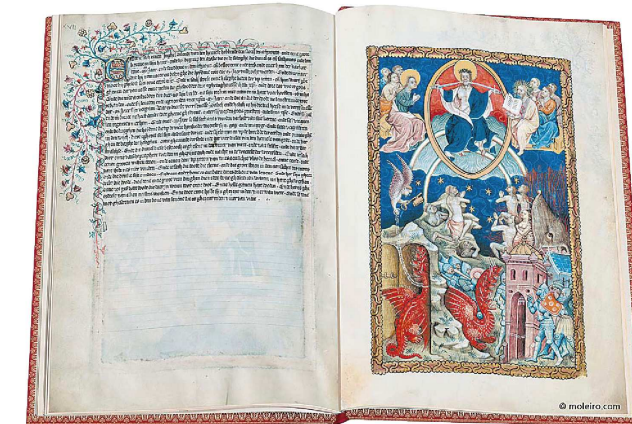
Fragmento del 'Apocalipsis Flamenco' editado por Moleiro, un códice de principios del XV.