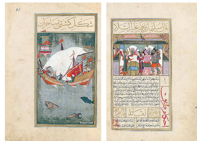
Ilustraciones de 'El Libro de la Felicidad', lo último de Moleiro Editores.

original conservado en la Biblioteca Nacional de Francia. Se trata de la primera novela de caballerías de la literatura española, escrita hacia el año 1304 por Ferrán Martínez, arcediano de Madrid, e ilustrada, entre otros, por Juan de Carrión, el más famoso de los miniaturistas hispano-flamencos. La última pieza de su colección es El Libro de la felicidad , un encargo del sultán Murad III al maestro Üstad Osman en la segunda mitad del siglo XVI, que consiste en un compendio de eruditos tratados astrológicos ilustrados con predicciones para los distintos signos.